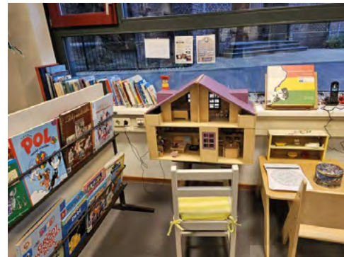
De vele prenten- en leesboeken in de Laeskamer

In 2024 hebben we 2.016 bezoekers geteld en zijn er 885 boeken uitgeleend.