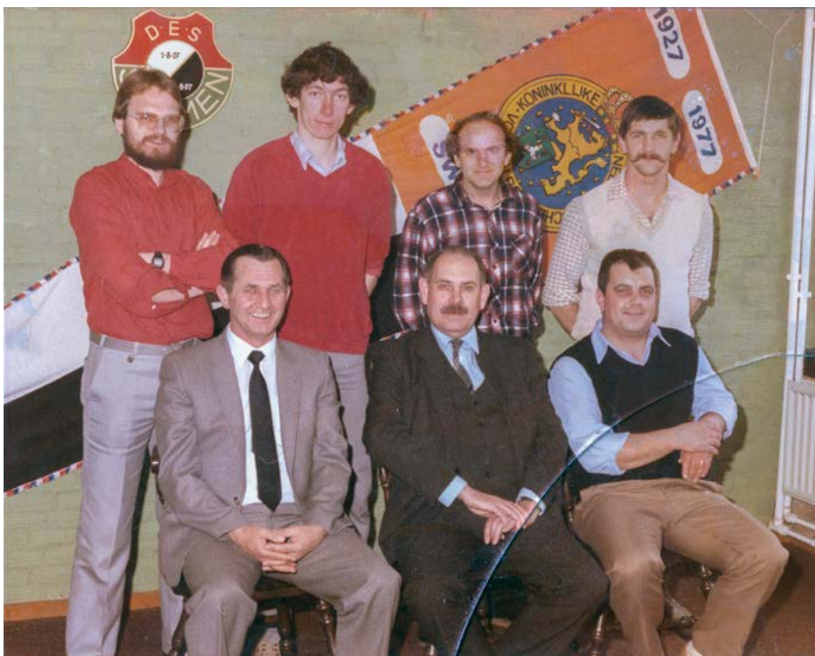
Comité Wielerdriedaagse (1982).

Veel voetballers hebben zo hun vaste rituelen. Ook Tuur had een bijzondere gewoonte. “Als we thuis speelden, gingen we rechtstreeks naar het zwembad of later naar sportpark De Bosberg. Maar als we een uitwedstrijd speelden, verzamelden wij ons op de zondagmorgen met het elftal in het clublokaal. Ik had de gewoonte om voor de wedstrijd twee glaasjes jonge jenever te drinken. Om de zenuwen een bedwang te houden. Dat was vaste prik. Als ik in het clublokaal kwam, klonk het al ‘Tuur, een borrel?’. Maar alleen bij de uitwedstrijden.” Uiteindelijk voetbalde Tuur meer dan 22 jaar. Hoe hij destijds stopte weet hij nog wel. “We gingen met de veteranen, het vijfde elftal, naar een toernooi in Montfort. Midden in augustus, het was snikheet. Je weet hoe het gaat op toernooien. Je voetbalt een half uur, dan een pauze, er wordt wat gedronken en dan moet je weer aantreden voor de volgende wedstrijd. Plotseling kreeg ik klachten aan mijn hart, waarschijnlijk door de hitte. Ik zei tegen