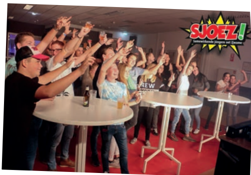
Een willekeurige greep uit de vele projecten: