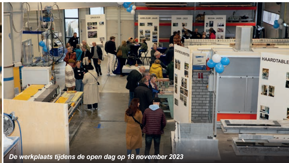
De werkplaats tijdens de open dag op 18 november 2023