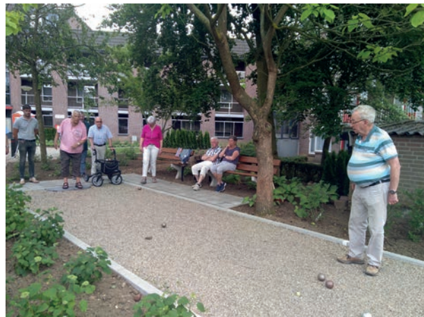
De jeu de boulesbaan aan Nopperhof