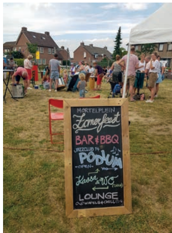
Zomerfeest Mortelplein