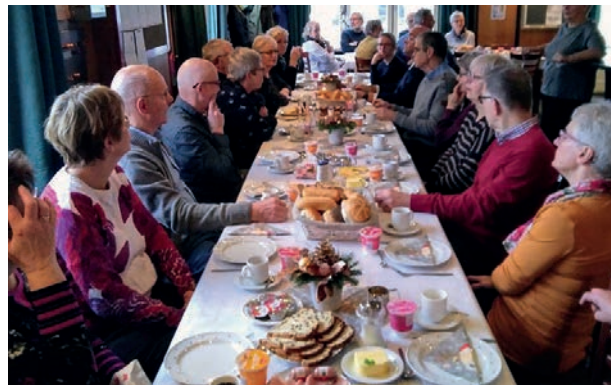
Vrijwilligers aan de brunch

Zo hebben we in het najaar van 2018 op verschillende punten langs de Rijksweg in Swalmen bloembollen laten planten. Dit zorgde in het voorjaar van 2019 (en in volgende jaren) voor een vrolijke entree in ons dorp. Ook is er in het voorjaar van 2019 een projectplan ingediend en goedgekeurd voor het plaatsen van een drietal bomen in boombakken in het gebied tussen St. Jansplein en Crasbornplein. Daarmee wordt niet alleen voorzien in een betere (groenere) aankleding, maar wordt ook gezorgd voor meer verkoeling en schaduw op deze doorgang. Ondanks het succes van deze kleinere initiatieven, is op dit dossier naar onze mening tot nu toe te weinig voortgang geboekt. Concrete plannen en voorstellen vanuit de Dorpsraad en BIZ-Centrum lopen kennelijk vast in de ambtelijke en bestuurlijke molens, ondanks de goede wil van individuen daarbinnen. We hopen dat er in 2020 daadwerkelijk zichtbare resultaten kunnen worden geboekt.