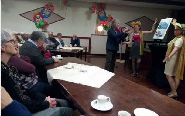
Voorstelling "Eige Sjöldj"

annex wadi; het begeleiden van kaartochtenden; het uitzoeken van voor de Laeskamer geschikte boeken; het organiseren van bijeenkomsten voor de jeugd (SJOEZ); het verrichten van lay-out werkzaamheden voor affiches en dergelijke. Een keer per jaar organiseren we als "dankjewel" een bijeenkomst voor al deze vrijwilligers. In 2019 was dat een gezamenlijke brunch, voorafgegaan door een wandeling langs verschillende door de Dorpsraad in gang gezette projecten.