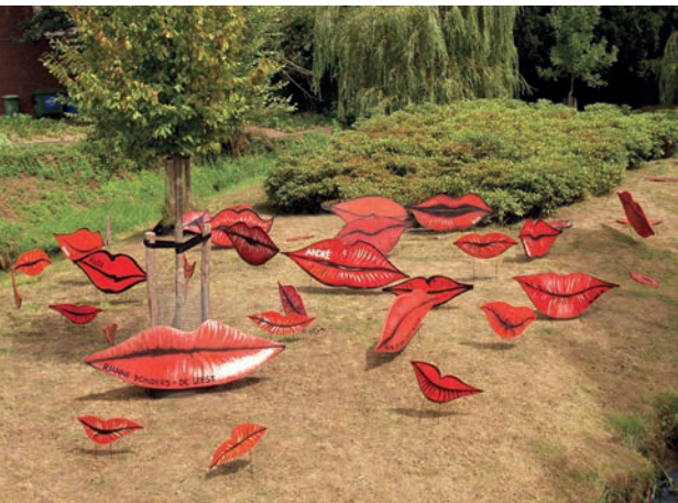
Tentoonstelling "Lass dich von den Musen küssen"