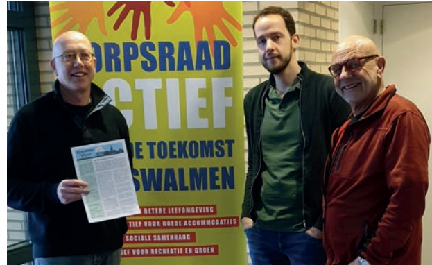
De redactie van de Zjwamer Gezet

Behalve de algemene bestuurlijke taken en het coördineren van de werkzaamheden van de verschillende werkgroepen, organiseert het bestuur ook zelf activiteiten en bijeenkomsten: