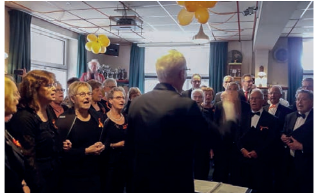
Serenade door Gemengd Koor A Cappella

In overleg met de gemeente, wijkagent en Gilde-opleidingen hebben we in het najaar een informatieavond georganiseerd over veiligheid in en rondom de eigen woning. Voorafgaand hieraan is door leerlingen van Gilde Opleidingen een rondgang door enkele wijken gemaakt waarbij ze "risicovolle" situaties in kaart gebracht hebben. Doel van de bijeenkomst was om het bewustzijn