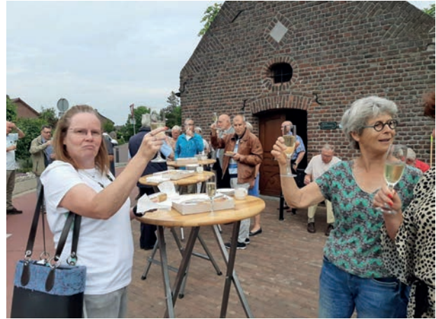
Toast op het resultaat

Reeds in 2013 zijn plannen gemaakt voor het verfraaien van de entree van Swalmen rond parkeerplaats Beeckerhof. Toen buurtbewoners begin 2018 kenbaar maakten dat de behoefte aan speelgelegenheid en aan groen groeide, is er een projectgroep geformeerd die zeer voortvarend aan het werk is gegaan. Op woensdag 26 juni is een druk bezochte