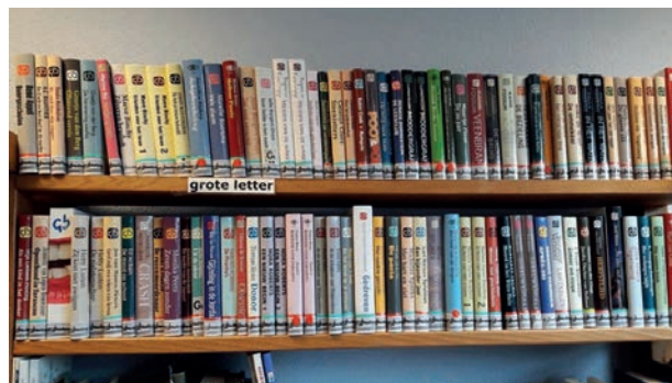
'Grote letterboeken' in de Laeskamer

Tot oktober 2019 zijn er maandelijkse bijeenkomsten gefaciliteerd in de Laeskamer, waarbij mensen elkaar kunnen ontmoeten met als doel een maatje te vinden of maatje te willen zijn. Dit project werd samen met de gemeente en stichting Wel.kom uitgevoerd. Helaas viel de