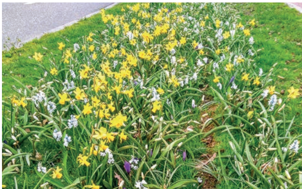
Bloembollen langs de Rijksweg in Swalmen

Zo hebben we in het najaar van 2018 op verschillende punten langs de Rijksweg in Swalmen bloembollen laten planten. Dit zorgde in het voorjaar van 2019 (en in volgende jaren) voor een vrolijke entree in ons dorp. Ook is er in het voorjaar van 2019 een projectplan ingediend en goedgekeurd voor het plaatsen van een drietal bomen in boombakken in het gebied tussen St. Jansplein en Crasbornplein. Daarmee wordt niet alleen voorzien in een betere (groenere) aankleding, maar wordt ook gezorgd voor meer verkoeling en schaduw op deze doorgang. Ondanks het succes van deze kleinere initiatieven, is op dit dossier naar onze mening tot nu toe te weinig voortgang geboekt. Concrete plannen en voorstellen vanuit de Dorpsraad en BIZ-Centrum lopen kennelijk vast in de ambtelijke en bestuurlijke molens, ondanks de goede wil van individuen daarbinnen. We hopen dat er in 2020 daadwerkelijk zichtbare resultaten kunnen worden geboekt.