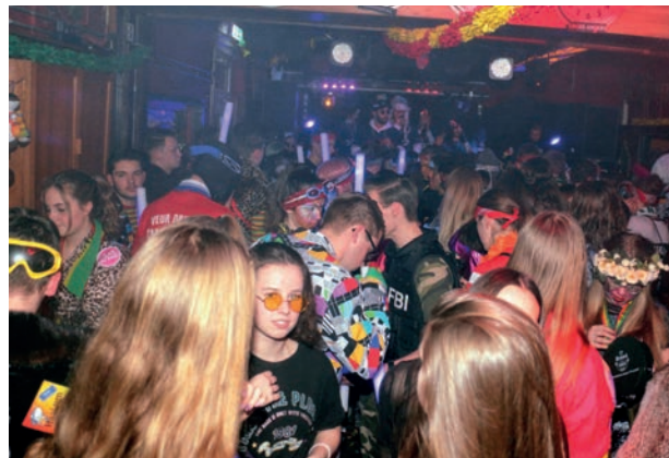
Glow in the Dark